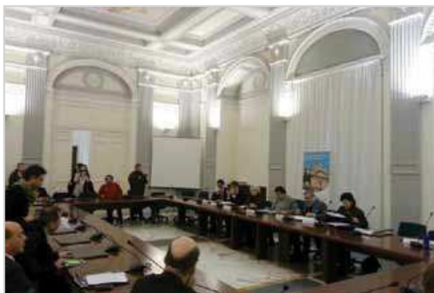
Lansarea raportului de cercetare a cadrului legal în Italia