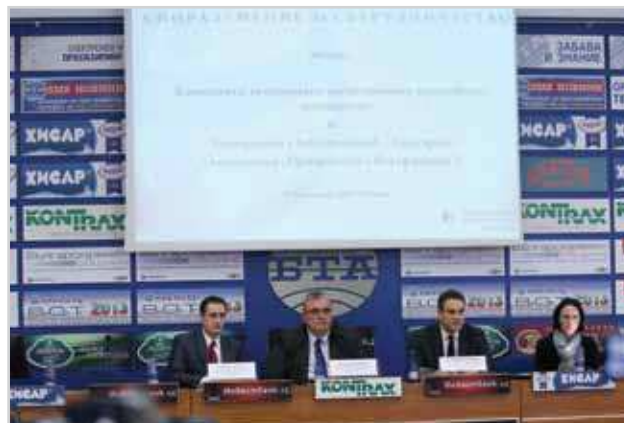
Semnarea acordului de cooperare între Transparency International Bulgaria și Comisia pentru Confiscarea Bunurilor Obținute Ilegal