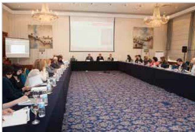
Lansarea raportului de cercetare a cadrului legal în Italia Bulgaria